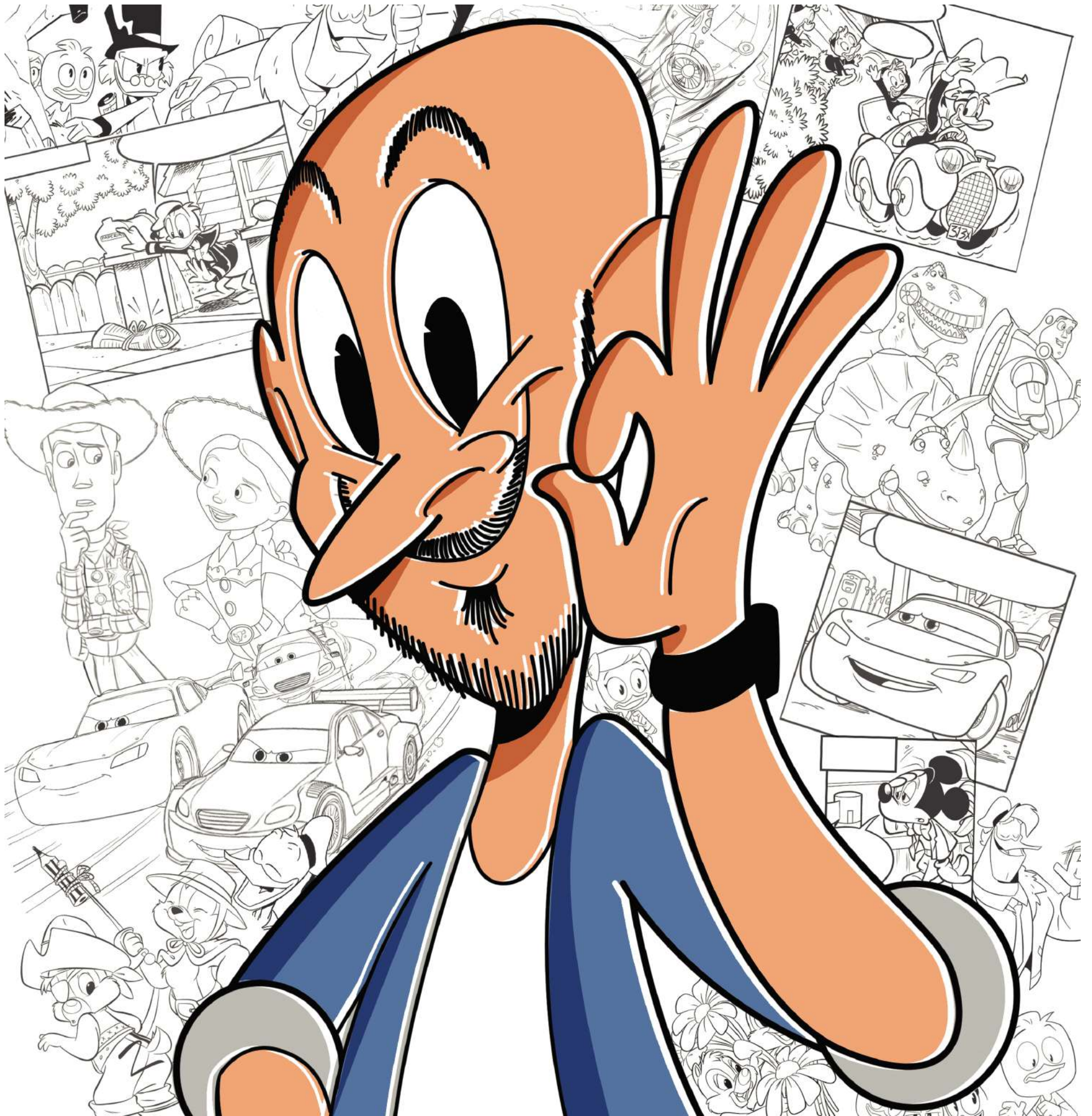
Illustrazione di Gianfranco Florio

Un nuovo corso di Gianfranco Florio per ragazze e ragazzi dai 12 ai 18 anni 13 lezioni, ogni lunedì dalle 17:00 alle 19:00 In Biblioteca dal 25 settembre 2023 Quota d'iscrizione: 10 €