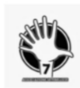
Azienda Speciale Consortile COMUNI INSIEME PER LO SVILUPPO SOCIALE