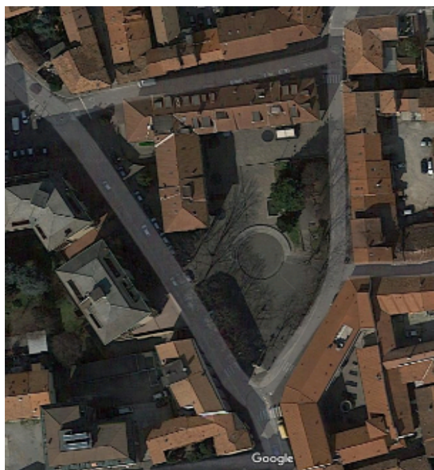
Piazza della Croce