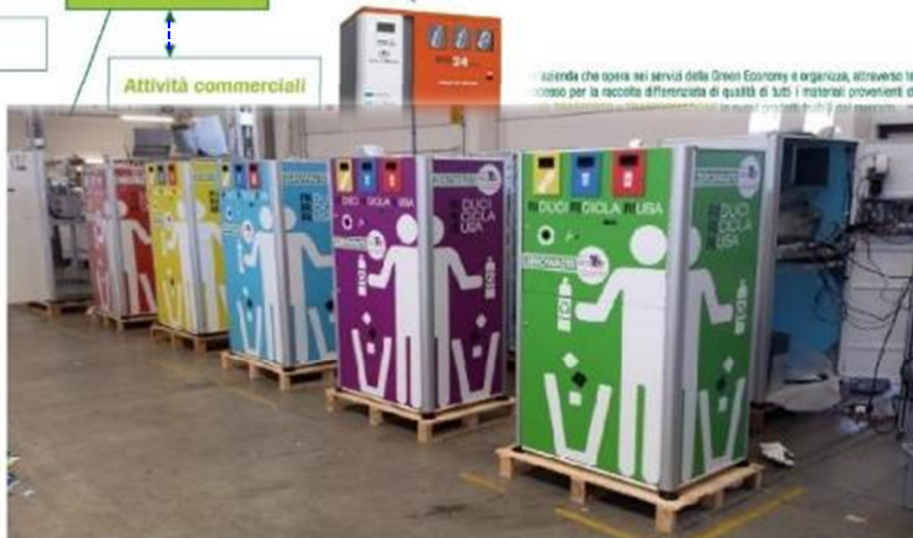
MONSELICE È LA PRIMA CITTÀ ITALIANA A RICARICARE IL CREDITO TELEFONICO CON IL RICICLO INCENTIVANTE

Attività che opera nei servizi della Green Economy e organizza, attraverso tecnologie innovative e automatiche, il processo per la raccolta differenziata di qualità di tutti i materiali provenienti da imballaggi e packaging sino allo smaltimento. Lettere di ALLUMNO, fascio Realizzato a titolo Interno dei nostri dispositivi, come che l'installazione, la ma-