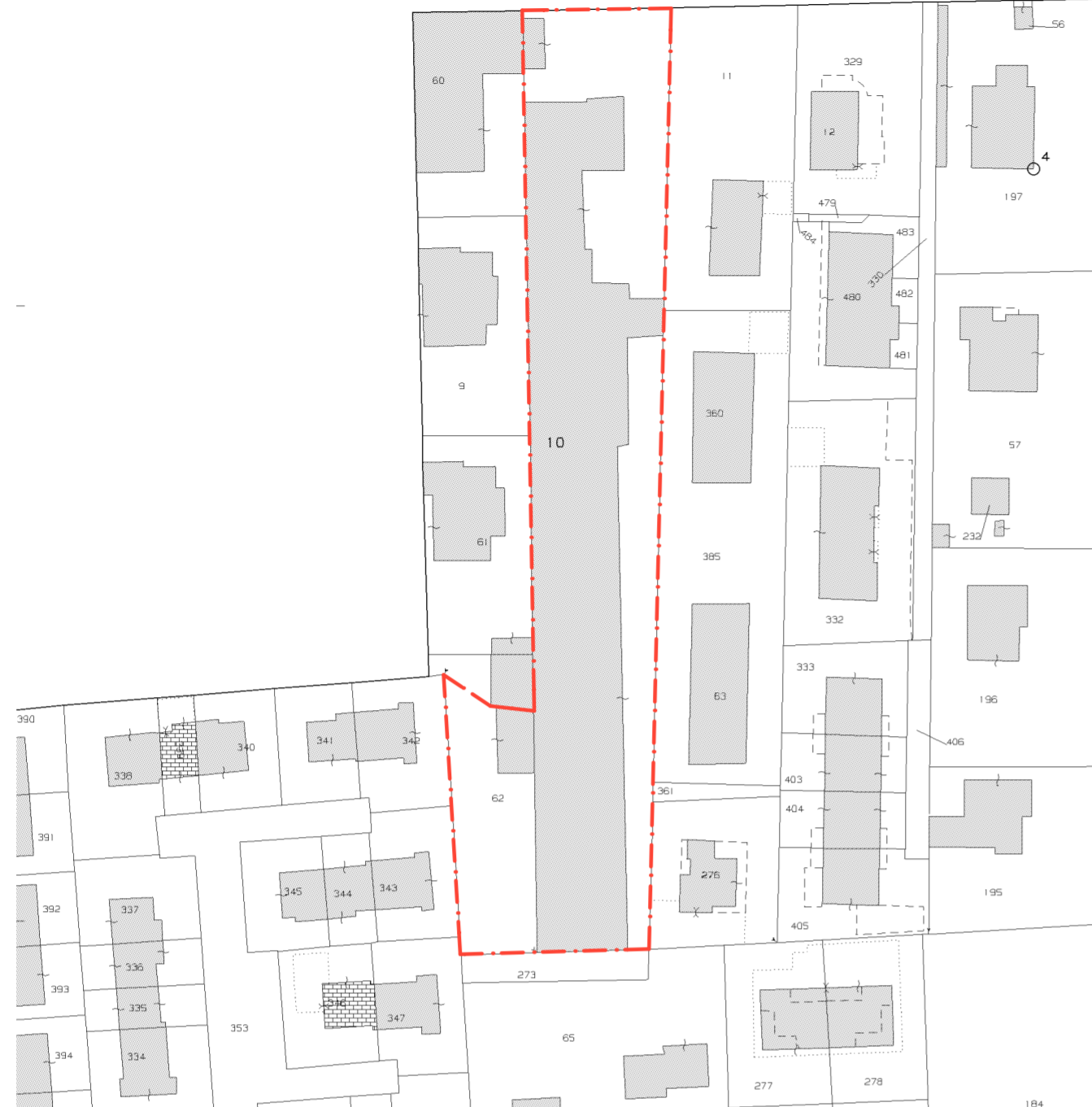
AT.R 1 Ex Vimar,